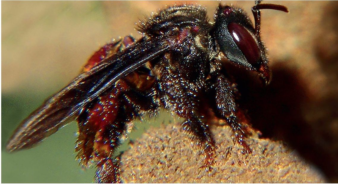
Abeja Apidae (Meliponini).