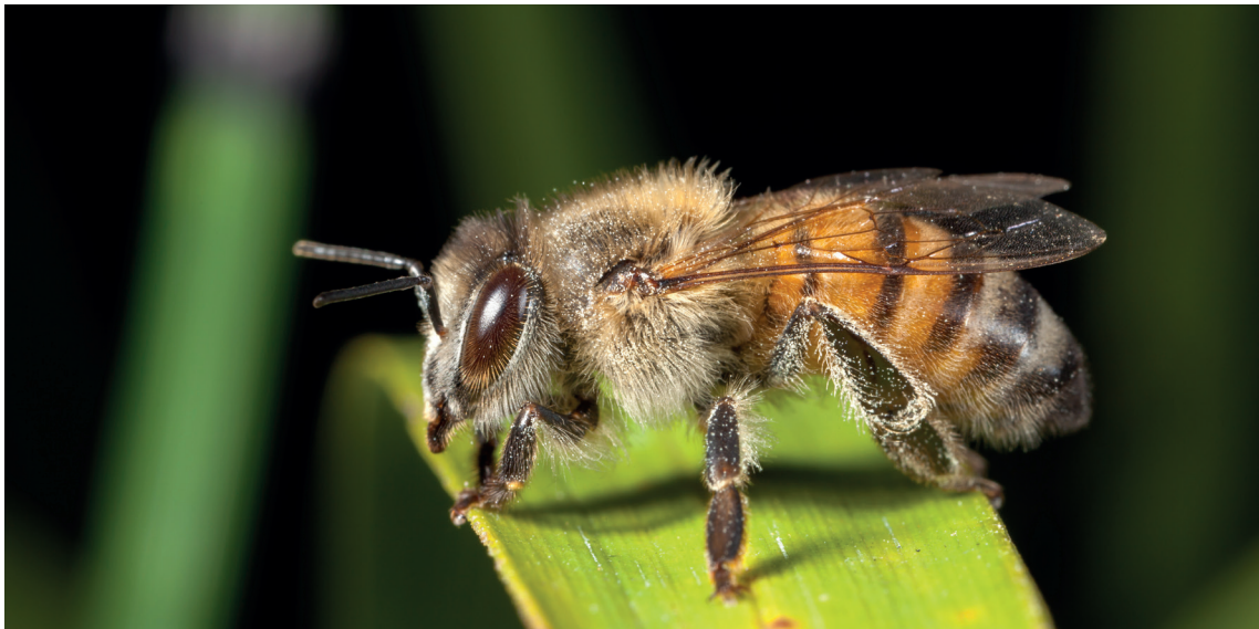
Abeja europea Apis mellifera

Las abejas son importantes bioindicadores de una agricultura sustentable (Kevan, 1999), por otro lado, el tamaño de sus poblaciones deben estar en relación a las características del paisaje y de los cultivos que polinizan (Artz, Hsu y Naukt, 2011; Aizen et al., 2014; Pisanty y Mandelik, 2015). Existen plantas que dependen de insectos polinizadores como el zapallo, calabazas, palto, cacao, entre otros (Carabalí et al., 2017; FAO, 2017; MINAM, 2020). Esta relación insecto - planta es fundamental considerarla en los planes de manejo de los paisajes donde los agroecosistemas son parte importante. Estas relaciones pueden verse afectadas por factores considerados como críticos, es el caso de la contaminación de abejas por plaguicidas, sean estas abejas producto de una crianza o silvestres (Brittain et al., 2010; Park et al. 2015), el manejo del cultivo (Johansen et al., 2019), entre otros.