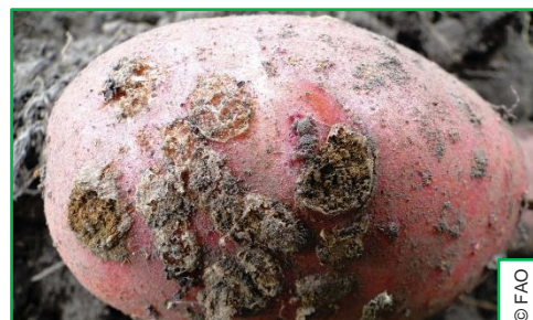
Síntomas avanzados afectados por Roña (Foto: 03)