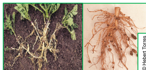
Agallas formadas en las raíces, causadas por el hongo (Foto: 04)