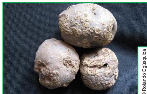
Tubérculo de Papa, afectado por Roña (Foto: 01)