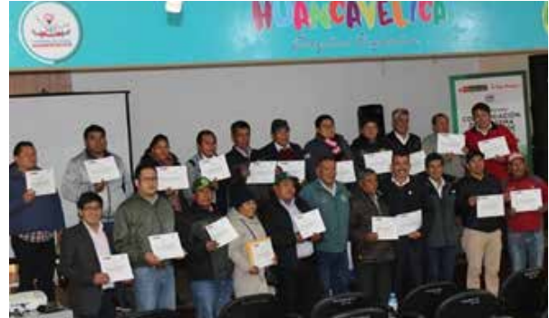
Figura 75. Implementación del SNIA en la región Huancavelica – Conformación de la Comisión Técnica en materia de Innovación Agraria y Construcción de la Agenda de Innovación Regional Agraria (Huancavelica, febrero de 2020)