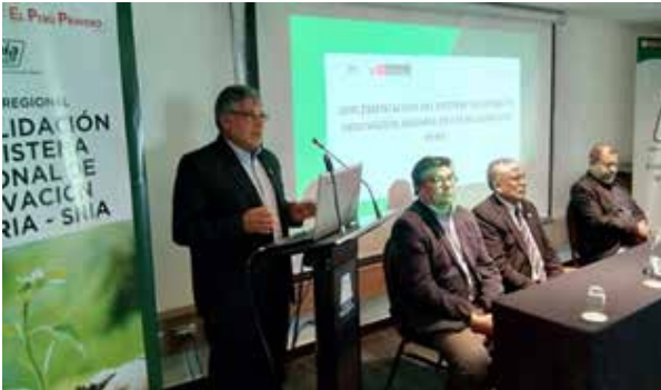
Figura 72. Implementación del SNIA en la región Arequipa – Conformación de la Comisión Técnica en materia de Innovación Agraria y Construcción de la Agenda de Innovación Regional Agraria (Arequipa, octubre de 2019)