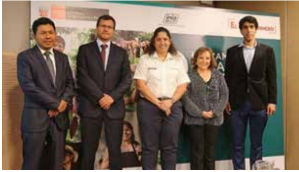
Figura 63. Lanzamiento de becas para pasantías nacionales e internacionales – Fondo Concursable 2019 (Lima, mayo de 2019)