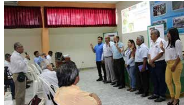
Figura 69. Implementación del SNIA en la región Piura – Conformación de la Comisión Técnica en materia de Innovación Agraria y Construcción de la Agenda de Innovación Regional Agraria (Piura, julio de 2019)