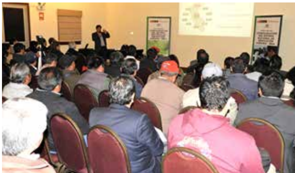
Figura 58. Encuentro Regional de Junín (Huancayo, agosto de 2018)