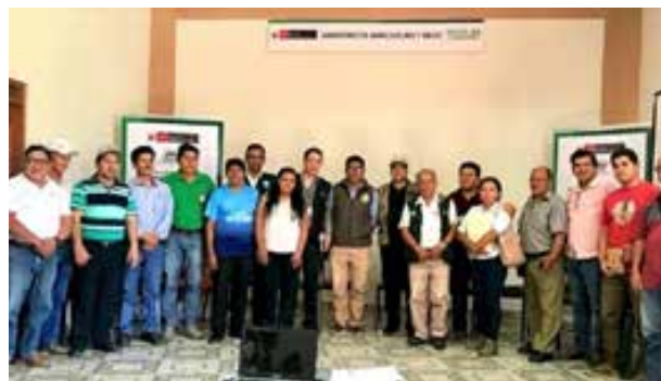
Figura 62. Consolidación del SNIA, distritos de Pichari y Kimbiri de la provincia de La Convención, Cusco Vraem (Cusco, abril de 2019)