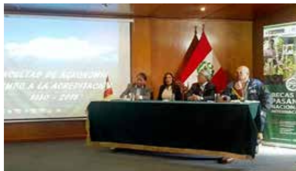
Figura 68. Taller informativo sobre becas para pasantías nacionales e internacionales – Fondo Concursable 2019 (Arequipa, junio de 2019)