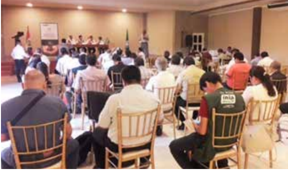
Figura 71. Implementación del SNIA en la región Loreto – Conformación de la Comisión Técnica en materia de Innovación Agraria y Construcción de la Agenda de Innovación Regional Agraria (Iquitos, julio de 2019)