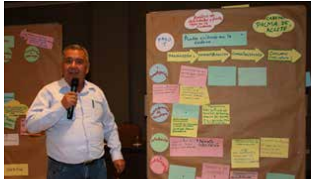
Figura 59. Encuentro Regional de Ucayali (Pucallpa, setiembre de 2018)