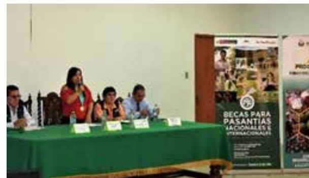
Figura 70. Taller informativo sobre becas para pasantías nacionales e internacionales – Fondo Concursable 2019 (Huánuco, julio de 2019)