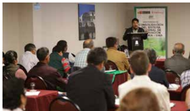
Figura 60. Encuentro Regional de Arequipa (Arequipa, octubre de 2018)