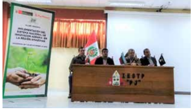
Figura 74. Implementación del SNIA en la región Amazonas – Conformación de la Comisión Técnica en materia de Innovación Agraria y Construcción de la Agenda de Innovación Regional Agraria (Chachapoyas, noviembre de 2019)