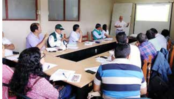
Figura 67. Implementación del SNIA en la Región San Martín / Conformación de la Comisión Técnica en Materia de Innovación Agraria y Construcción de la Agenda de Innovación Regional Agraria (Tarapoto, junio de 2019)