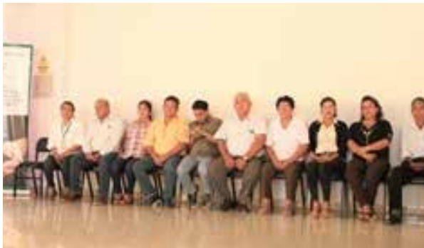
Figura 65. Implementación del SNIA en la Región Tumbes / Conformación de la Comisión Técnica en Materia de Innovación Agraria y Construcción de la Agenda de Innovación Regional Agraria (Tumbes, junio de 2019)