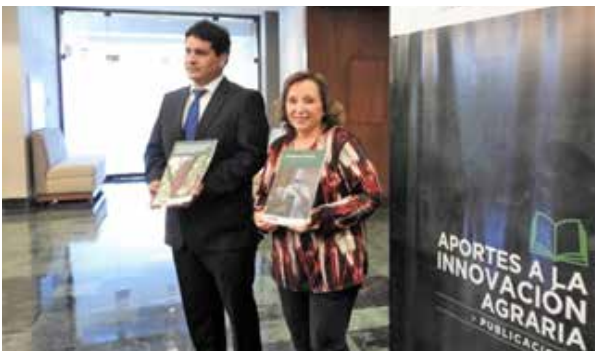
Figura 66. Aportes a la Innovación Agraria – Sistematización de las experiencias de subproyectos del INIA financiados por el PNIA (Lima, junio de 2019)