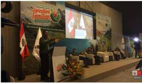
Figura 73. Lanzamiento del Decenio de la Agricultura Familiar y la XXI Convención Nacional del Agro Peruano (Lima, noviembre de 2019)