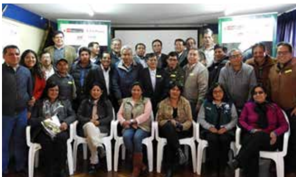
Figura 56. Encuentro Regional de Cusco (Cusco, junio de 2018)