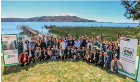
Figura 55. Encuentro Regional de Puno (Puno, abril de 2018)