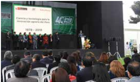
Figura 57. Encuentro con Representantes Nacionales del SNIA (Lima, julio de 2018)