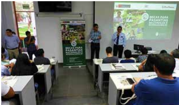
Figura 64. Taller informativo sobre becas para pasantías nacionales e internacionales – Fondo Concursable 2019 (Piura, junio de 2019)