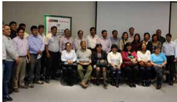
Figura 61. Encuentro Regional de Moquegua (Moquegua, octubre de 2018)