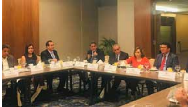
Figura 76. Encuentro INIA – Gobiernos Regionales (Lima, febrero de 2020)