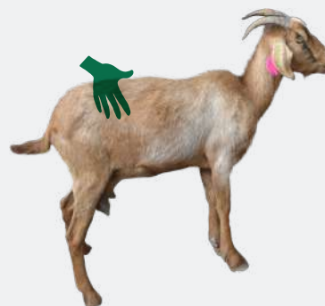
Figura 2. Evaluación de la cantidad de músculo y grasa mediante palpación

Recuerda: La región lumbar se ubica entre la última costilla y la cadera