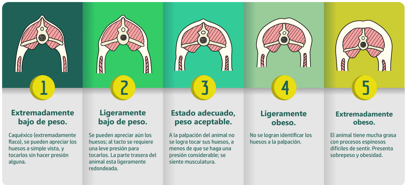
Figura 3: Escala de condición corporal lumbar.