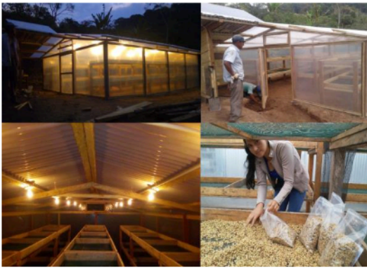
Figura 1. Prototipo de secado de café utilizando energía fotovoltaica.

El sistema además contó con un panel solar, baterías secas, cables, convertidor, sensor de humedad y temperatura y un medidor de humedad en grano. Las dimensiones fueron de 4,56 m. de ancho y 8,00 m. de largo, con un área total de 36,48 m 2 . Las bandejas de secado fueron distribuidas en tres líneas y dos niveles. Cada bandeja de secado fue de 1 m 2 y contó con malla reforzada como soporte para el grano de café. Este sistema de generación de calor provino de la captación de la energía solar. Se usó un convertidor de energía y un sistema de baterías para su almacenamiento. Esta energía fue utilizada durante la noche para el funcionamiento de los focos que generaban calor en el interior del túnel de secado.