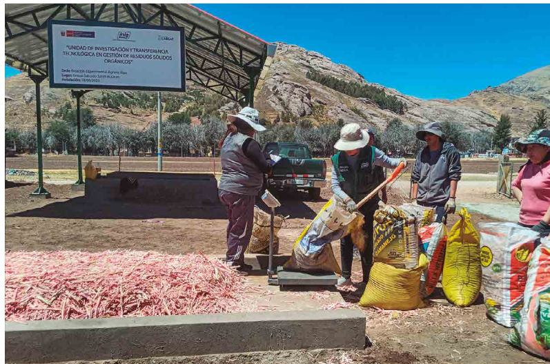
Figura 20. Acopio de material para compostaje