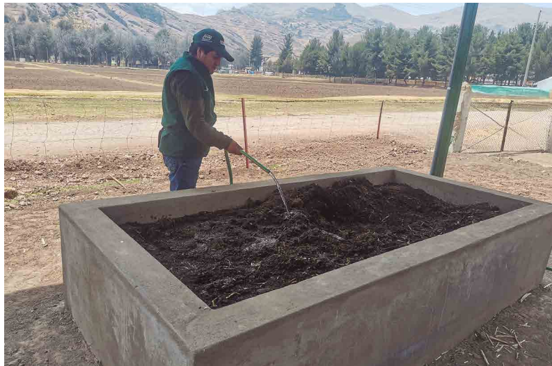
Figura 33. Camas de producción de humus protegidas en proceso de regado

El tamaño puede ajustarse según la disponibilidad de alimento para las lombrices.