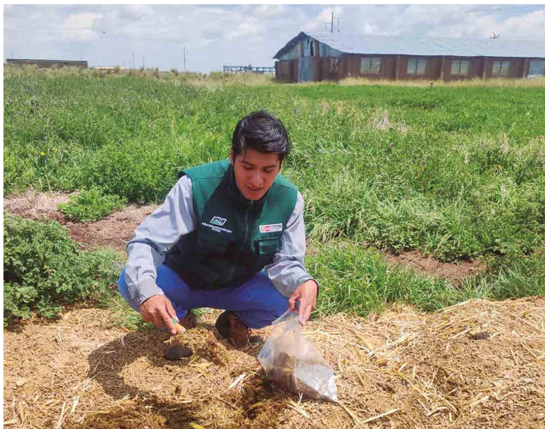
Figura 4. Depósito de estiércoles