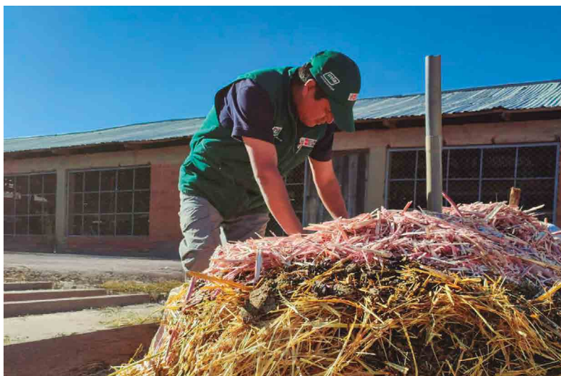
Figura 24. Colocación de tubo PVC para respiradero