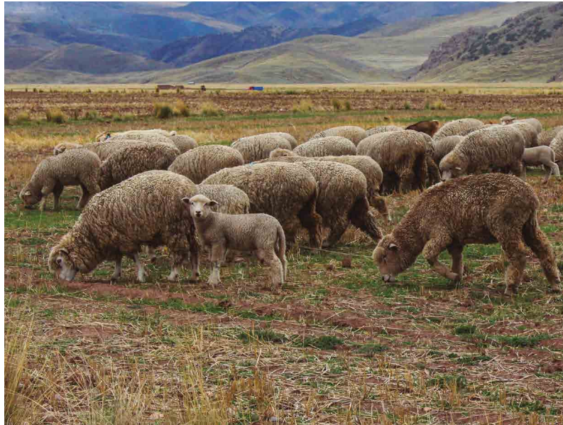
Figura 8. Hato de ovinos

Según Villagaray-Lizana et al. (2021), la dosis óptima de estiércol de ovino para el cultivo de papa es de 1.50 kg por planta, con la cual se alcanzó un rendimiento promedio de 20.31 t/ha. Sin embargo, al considerar el enfoque económico, los mismos autores señalaron que las dosis de 0.50 y 0.25 kg de estiércol por planta resultaron ser más rentables, ya que implicaron menores costos de insumo sin afectar significativamente la producción.