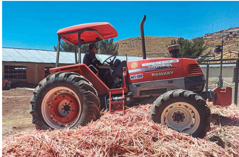
Figura 21. Desmenuzando de la broza para la preparación del compost

Para facilitar la descomposición, se deben picar y mezclar todos los residuos vegetales antes de iniciar el proceso (Figura 21).