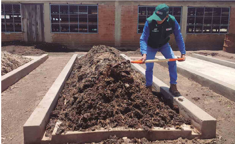
Figura 28. Primer volteo del compost a los 15 días