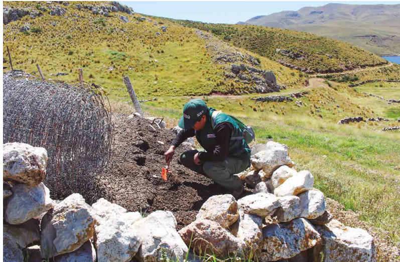
Figura 29. Evaluación de la madurez del compost

El compost estará listo para su uso cuando adquiera un color marrón oscuro, tenga una textura homogénea, no emita olores fuertes y no se distinguen residuos vegetales sin descomponer (Figuras 29 y 30).