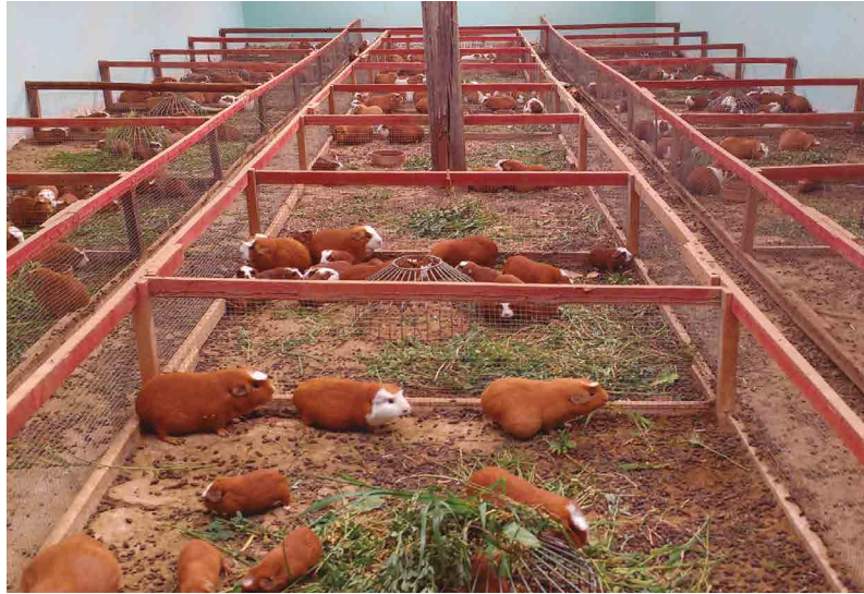
Figura 10. Producción de cuyes en galpones de crianza