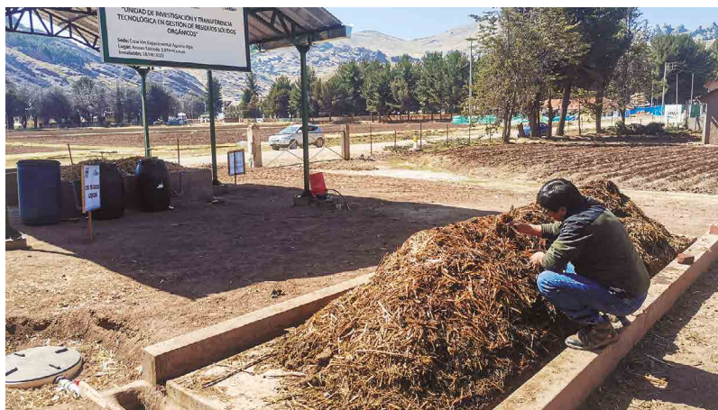
Figura 27. Evaluación de humedad del compost