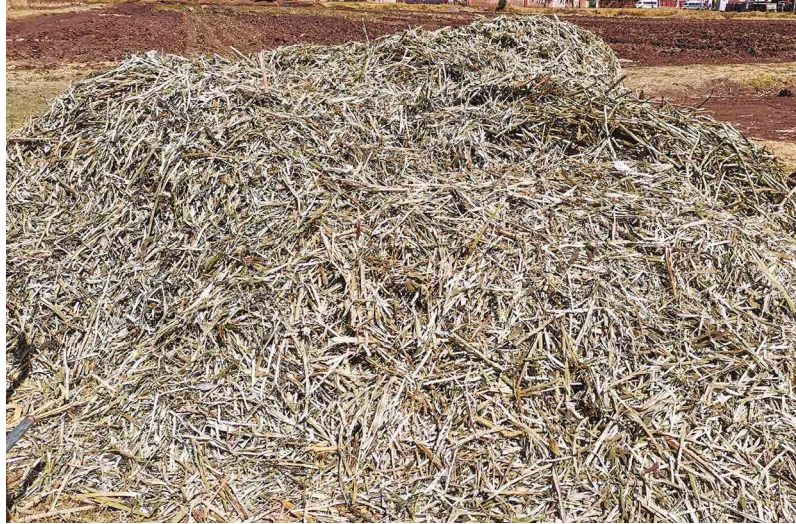
Figura 13. Broza de haba

En el Perú, la producción de haba está concentrada en regiones altoandinas, donde se cultiva a pequeña y mediana escala. Tras la cosecha, grandes cantidades de broza quedan en los campos sin ser aprovechadas eficientemente, lo que representa una oportunidad para su valorización en sistemas sostenibles.