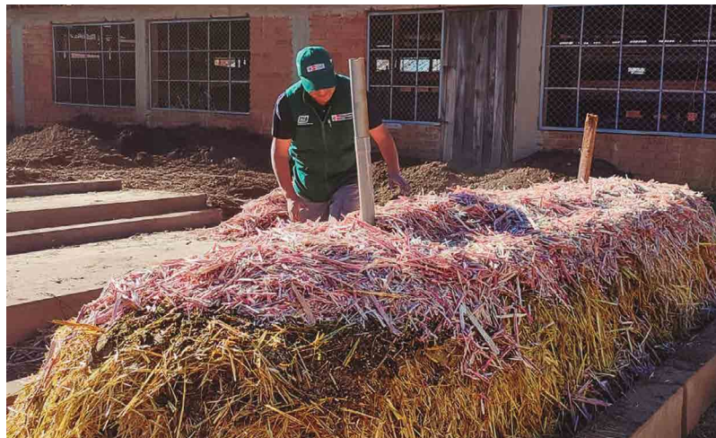
Figura 23. Pila de compost debidamente humedecido y compactado

Se repite este proceso hasta completar cinco ciclos de capas.