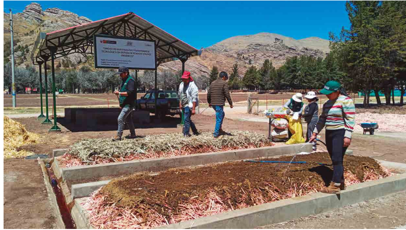
Figura 22. Amontonamiento de broza vegetal y estiércol

Las capas sucesivas de materiales se acondicionan en este orden (Figura 23):