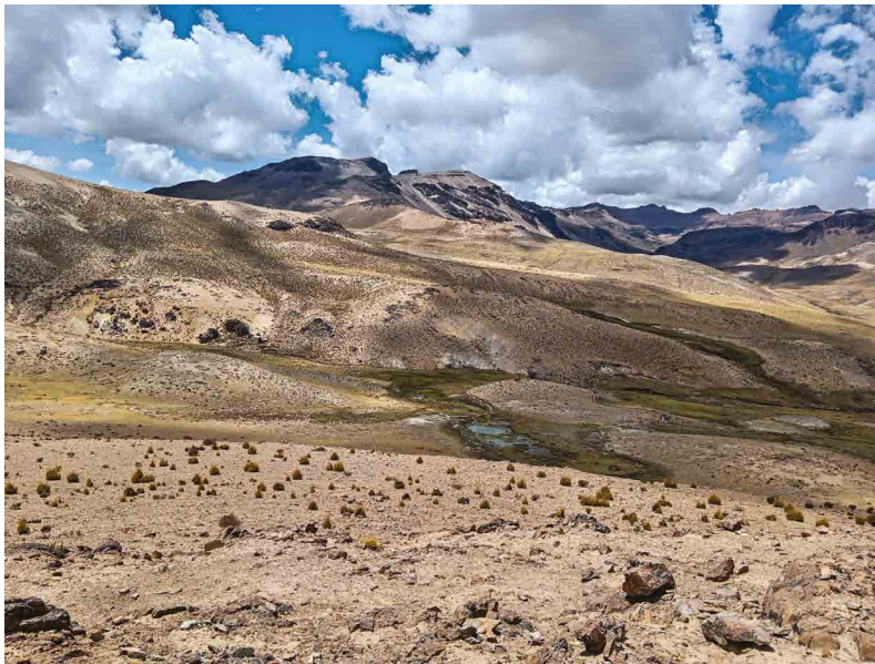
Figura 1. Suelos en proceso de degradación y desertificación