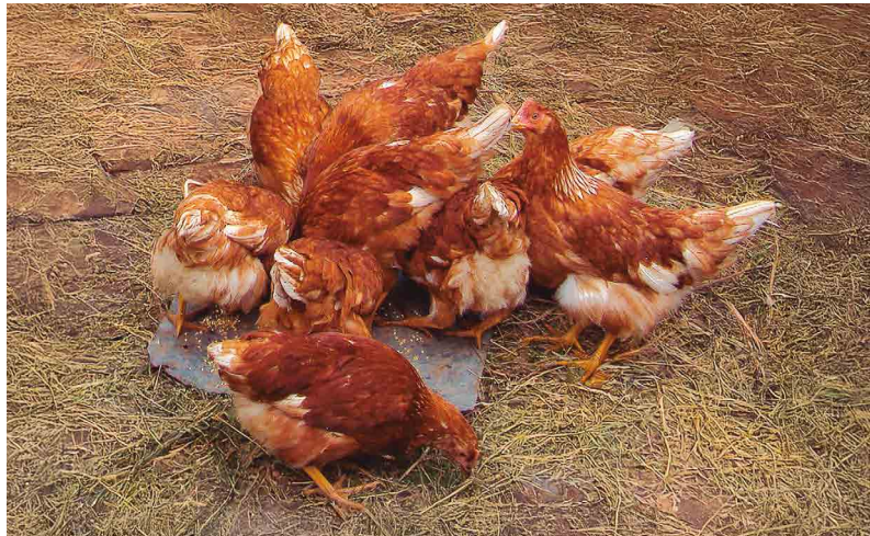
Figura 11. Producción de gallinaza en granjas familiares

en la gallinaza se mineraliza en solo tres semanas, haciéndolo rápidamente disponible para las plantas. Por ejemplo, al aplicar 10 toneladas de gallinaza con un 80 % de materia seca y un 4 % de nitrógeno, se aporta aproximadamente 320 kg de nitrógeno orgánico, de los cuales 240 kg serían aprovechables por el cultivo en poco tiempo. Estos valores demuestran su gran potencial como fertilizante eficiente y de rápida acción en la agricultura (Estrada-Pareja, 2005).