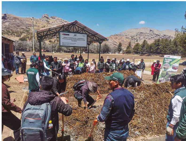
Figura 15. Compost de 15 días de maduración

El proceso de compostaje no solo recicla residuos agrícolas y ganaderos, sino que también reduce las emisiones de gases de efecto invernadero, siendo su uso una práctica agrícola sostenible (Janssen et al., 1990). Además, el compost actúa como un mejorador de las propiedades físicas y químicas de los suelos con efectos positivos en el crecimiento y desarrollo de los cultivos y en la conservación de los suelos.