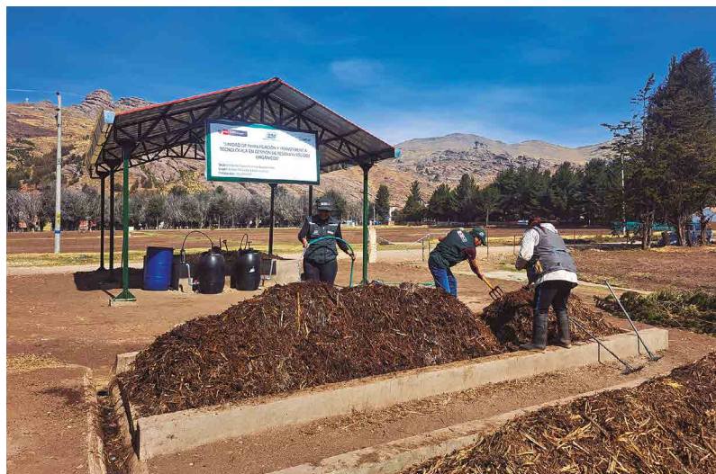
Figura 19. Ubicación del espacio de producción de abonos orgánicos

El terreno debe ser permeable y ligeramente elevado para evitar encharcamientos que puedan generar condiciones anaeróbicas y malos olores. En suelos compactos o con poca capacidad de drenaje, se recomienda colocar una base de material poroso, como ramas o piedras, para mejorar la aireación.