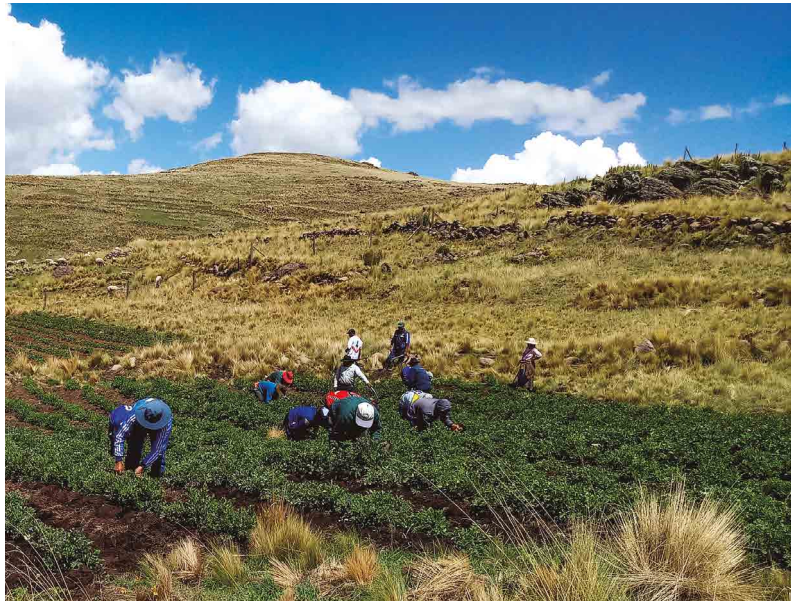
Figura 5. Uso de estiércol en la fertilización de cultivos

Los estiércoles provienen de diversas especies animales, entre ellas llamas, alpacas, ovinos, bovinos, cuyes y gallinas. La calidad del estiércol varía según la especie, el tipo de cama utilizada y el manejo previo a su aplicación en los cultivos.