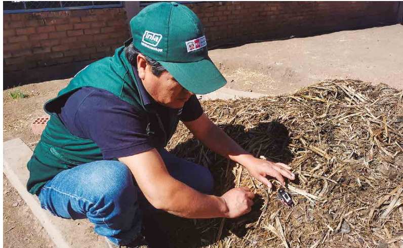
Figura 26. Evaluación de la temperatura de la pila de compost