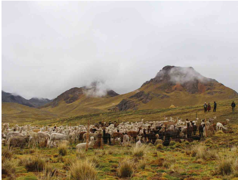
Figura 2. Crianza de ovinos y camélidos de un hato ganadero

Además de la producción agrícola, los pobladores andinos incorporan la ganadería como una actividad clave dentro de sus sistemas productivos (Figura 2). Dependiendo de los pisos agroecológicos, las cranzas suelen ser mixtas, incluyendo vacunos, ovinos, camélidos (alpacas y llamas), porcinos, cuyes y aves de corral en menor escala. Estos animales se alimentan de pastos naturales, pastos cultivados y alimentos procesados y concentrados, generando productos como carne, fibra, leche, estiércol y orina. Los excrementos, en su mayoría, son depositados en las pasturas o en corrales, con un aprovechamiento variable según la región (Benzing, 2001).