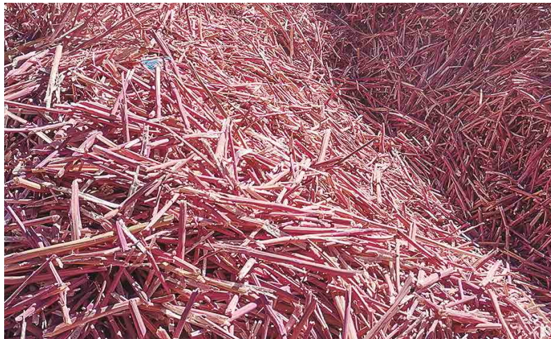
Figura 12. Broza de quinua

La cosecha de quinua genera residuos lignocelulósicos conocidos como broza o k'iri (Figura 12), y también residuos de la trilla del grano denominados jipi , los cuales incluyen tallos, pedúnculos, hojas secas y restos de granos (Tapia y Fries, 2007). La broza está compuesta por el tallo principal, ramas laterales, pedúnculos y hojas secas, mientras que el jipi corresponde a los residuos que quedan tras el proceso de venteo. Por su composición nutricional, especialmente su alto contenido de proteínas y la presencia de micronutrientes como calcio (Ca) y fósforo (P), el jipi se utiliza como insumo en la alimentación de aves de corral y otros animales de granja (Pardo-Sánchez, 2022).