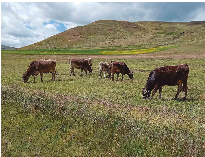
Figura 9. Estiércol de vacunos depositados a la intemperie

En términos generales, el estiércol fresco de bovino contiene: 20 a 25 % de materia seca, 0.37 a 0.60 % de nitrógeno (N), 0.25 a 0.35 % de fósforo ( P_2O_5 ) y 0.15 a 0.76 % de potasio ( K_2O ), además de otros nutrientes en menores proporciones, (Berríos, 2016, citando a Flores y Fred, 1990). Asimismo, se considera un estiércol frío, lo que significa que su descomposición es más lenta, pero su efecto fertilizante es más prolongado en el tiempo. Por ello, es especialmente recomendado para suelos ligeros o arenosos, donde ayuda a mejorar la estructura y el contenido de materia orgánica del suelo.