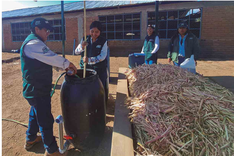
Figura 36. Preparación de biol en biodigestores

Su alto contenido de fitorreguladores, microorganismos benéficos y nutrientes esenciales lo convierte en un recurso valioso para mejorar la fertilidad del suelo y la productividad agrícola. Además, el biol estimula la actividad biológica del suelo, optimiza la retención de agua y crea un microclima favorable para el desarrollo de las plantas.