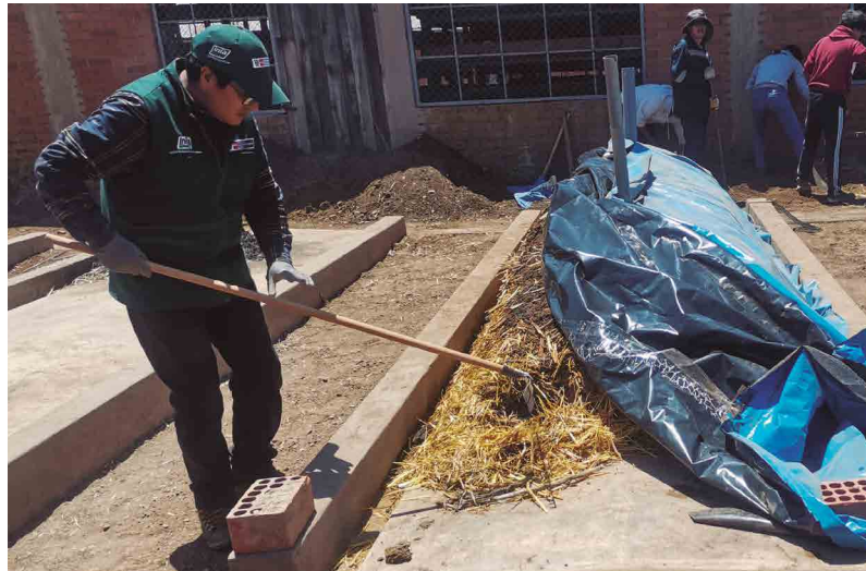
Figura 18. Evaluación periódica del compost

La calidad del compost depende del correcto desarrollo de cada una de las fases del compostaje. Por ende, es de suma importancia el monitoreo periódico de los residuos que atraviesan por este proceso (Figura 18).