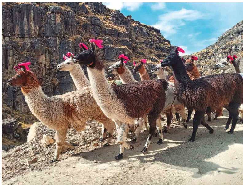
Figura 6. Llamas en zonas andinas

En el estudio de Mamani y Bonifacio (2023) se evaluó el efecto del estiércol de llama tratado durante 45 días con activadores de descomposición, en la producción de quinua (variedad Jacha Grano) en el altiplano. Los resultados demostraron mejoras significativas en la germinación temprana, mayor altura de planta (86.5 cm frente a 76.9 cm del testigo sin estiércol) y aumento en el rendimiento de grano (3 592.5 kg/ha con 10 t/ha de estiércol tratado, frente a 2 617.5 kg/ha del testigo sin estiércol). El análisis químico destacó un contenido de nitrógeno del 0.1 % en el estiércol fresco, subrayando su potencial como fertilizante natural.