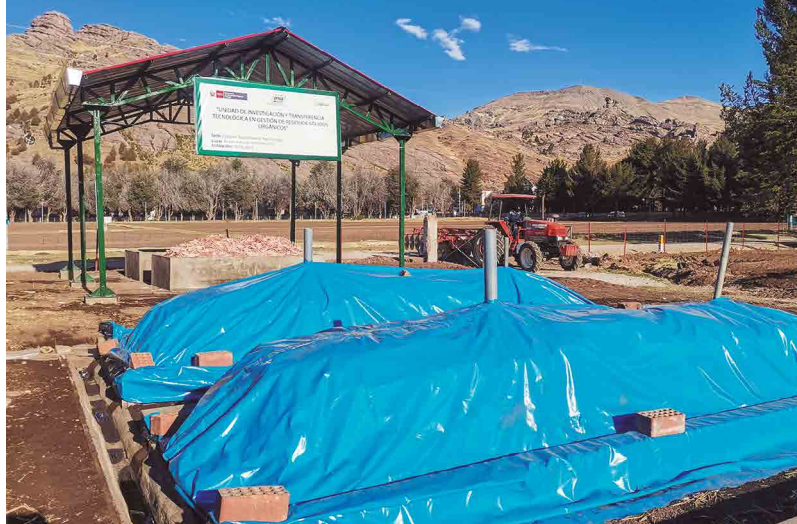
Figura 25. Tapado con manta plástica