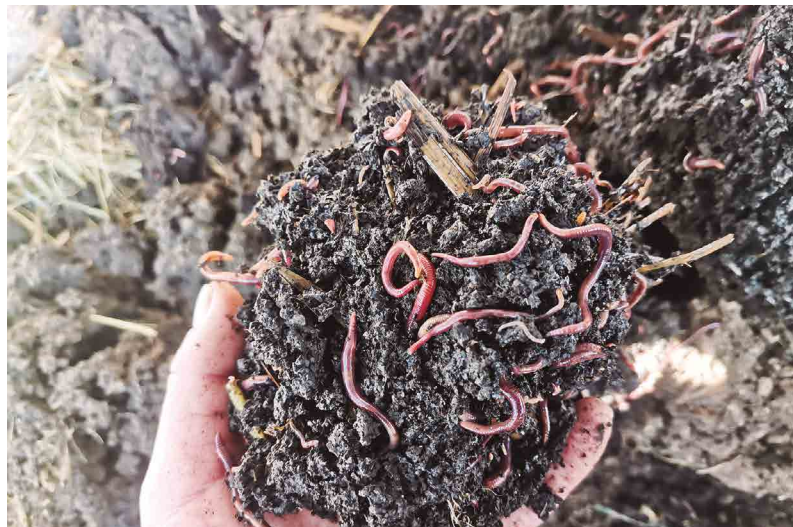
Figura 31. Crianza de lombriz californiano para la producción de humus

El vermicompost, también conocido como humus de lombriz (Figura 31), es un abono orgánico de alta calidad obtenido por las lombrices, especialmente de la especie Eisena foetida (lombriz roja californiana), a través del proceso de digestión de la materia orgánica (FAO, 2013).