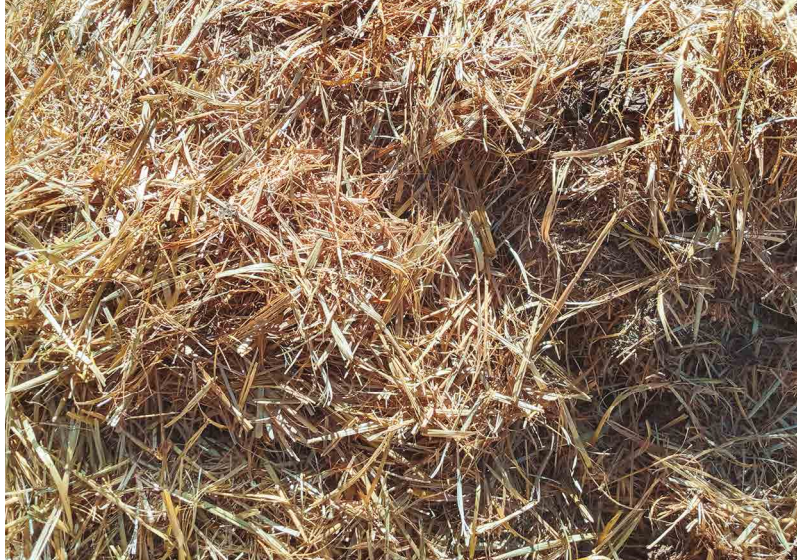
Figura 14. Broza o residuo de avena