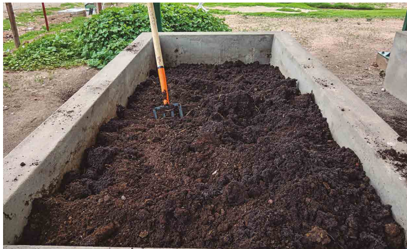
Figura 35. Humus de lombriz maduro listo para su cosecha

Finalmente, el humus debe almacenarse en bolsas limpias libre de grasas y toxicidad y guardarse en un lugar fresco, manteniendo una humedad del 40 % para conservar su calidad.