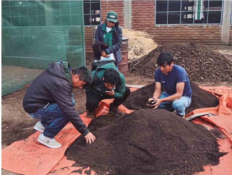
Figura 16. Prueba de humedad del compost