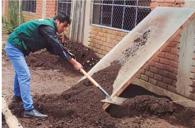
Figura 30. Cosecha y zarandeo de compost maduro