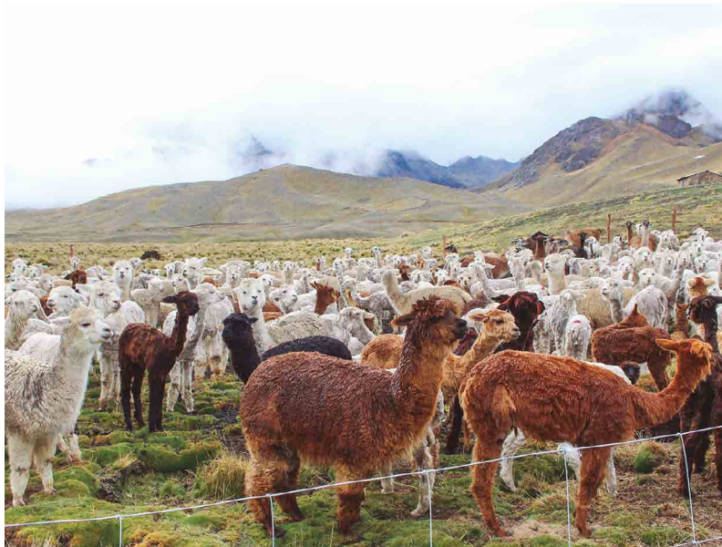
Figura 7. Hato de alpacas

Por otro lado, el estiércol de alpaca (Figura 7) destaca por su alto contenido de nutrientes. Su análisis reveló una conductividad eléctrica de 11.65 mmhos/cm, lo que indica una concentración moderadamente elevada de sales solubles beneficiosas para enriquecer el suelo. Sin embargo, su aplicación requiere precaución en suelos propensos a la salinización, ya que podría exacerbar este problema (INIA, resultados no publicados). Su pH de 7.96 lo clasifica como ligeramente alcalino, característica que puede contribuir a neutralizar suelos ácidos. Destaca su alto contenido de materia orgánica (71.33 %), ideal para mejorar la estructura, la retención de agua y la actividad biológica del suelo. Además, aporta un 1.98 % de nitrógeno total, fundamental para el crecimiento vegetal, junto a 1.09 % de fósforo ( P_2O_3 ), que favorece el desarrollo radicular y la floración, y 2.07 % de potasio ( K_2O ), importante para la resistencia a enfermedades y la calidad de los frutos. El estiércol también contiene 5.29 % de calcio (CaO), que mejora la estructura del suelo y el desarrollo celular, y 1.92 % de magnesio (MgO), esencial para la fotosíntesis. Su bajo contenido de humedad (8.45 %) facilita el manejo y almacenamiento, y la relación carbono/nitrógeno de 20.59 es adecuada para una descomposición relativamente rápida y una eficiente liberación de nitrógeno al suelo (Noli-Hinostroza, 1999).