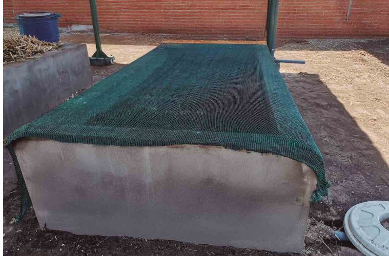
Figura 34. Cama de producción de humus