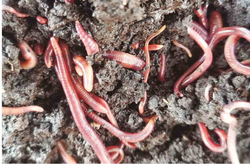
Figura 32. Lombriz roja californiana ( Eisenia foetida )