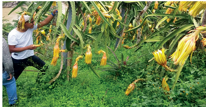
Figura 13. Eliminación manual de pétalos secos de la flor de la pitahaya.