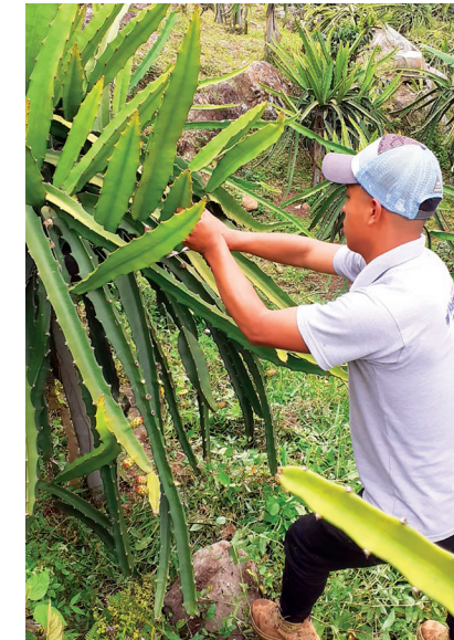
Figura 12. Poda de producción.