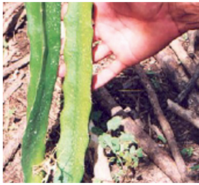
Figura 6. Selección de esquejes.