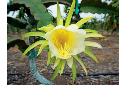
Figura 3. Flor de pitahaya amarilla.

Tienen forma de trompeta, son hermafroditas y miden aproximadamente 20 cm de largo. Se localizan en la parte más alta de la planta, para que los rayos del sol puedan alcanzarlas. Su coloración puede ser blanca, amarilla o rosa (Figura 3). La fecundación puede ser cruzada o auto fecundada (Sánchez, 2018).