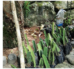
Figura 8. Almacigado en bolsas.