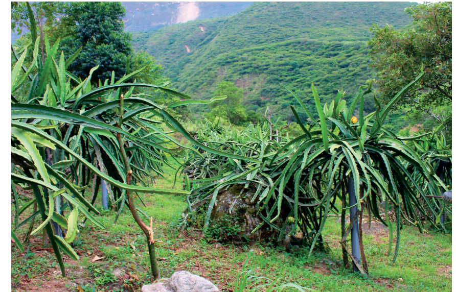
Figura 10. Tutores en cultivo de la pitahaya.

importante indicar que la señalización y hoyado de los sitios destinados para los postes, deben efectuarse con anterioridad a la siembra o trasplante, para evitar posibles daños a los esquejes (Sánchez, 2018).