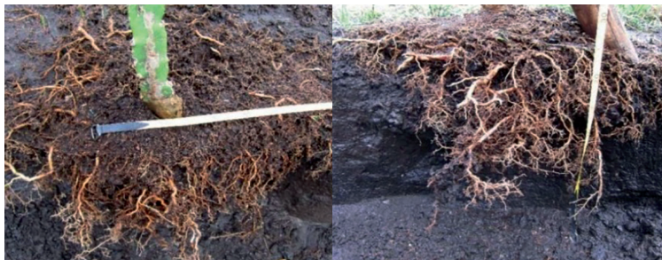
Figura 1. Desarrollo del sistema a de raíces de plantas de la pitahaya.

Posee un sistema radicular subterráneo, con raíces aéreas que crecen de los filocladios (Figura 1), tienen la función de anclaje en la superficie donde se apoyan, sean paredes, postes, laderas, etc (Vasquez y Bacalla, 2018).