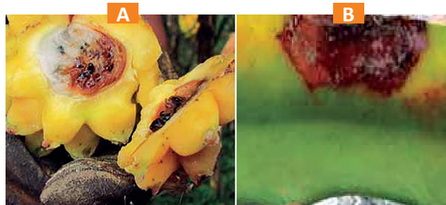
Figura 14. Síntomas de la pudrición basal. A) En frutos. B) En pencas.