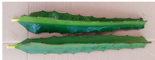
Figura 2. Tallo modificado denominado filocladio.

El tallo de la pitahaya es de color verde claro y presenta una estructura modificada denominada filocladio (Figura 2). Posee tres hendiduras formando tres lóbulos o tres tallos angulados, cuyas aristas son curvadas hacia el interior de la planta y en los extremos de las depresiones, presenta una areola con 3 a 4 espinas (Vasquez y Bacalla, 2018).