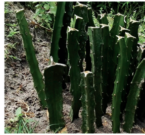
Figura 7. Almacigado en sustrato.