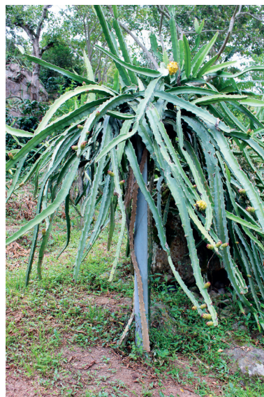
Figura 11. Poste modificado.

Existen otros sistemas que emplean soporte de madera de forma cuadrada, donde se soportan las ramas, es más económico, pero presentan una menor duración por su rápido deterioro por la humedad y ataque de insectos.