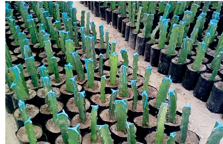
Figura 9. Producción de esquejes de la pitahaya.