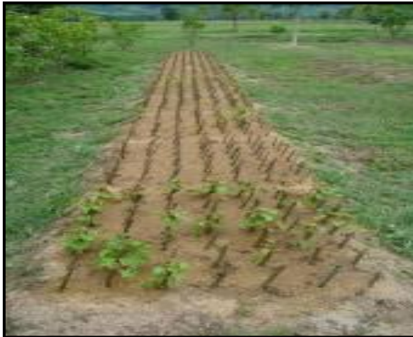
FOTO: Brotamiento de Estacas de Jatropha ecotipo