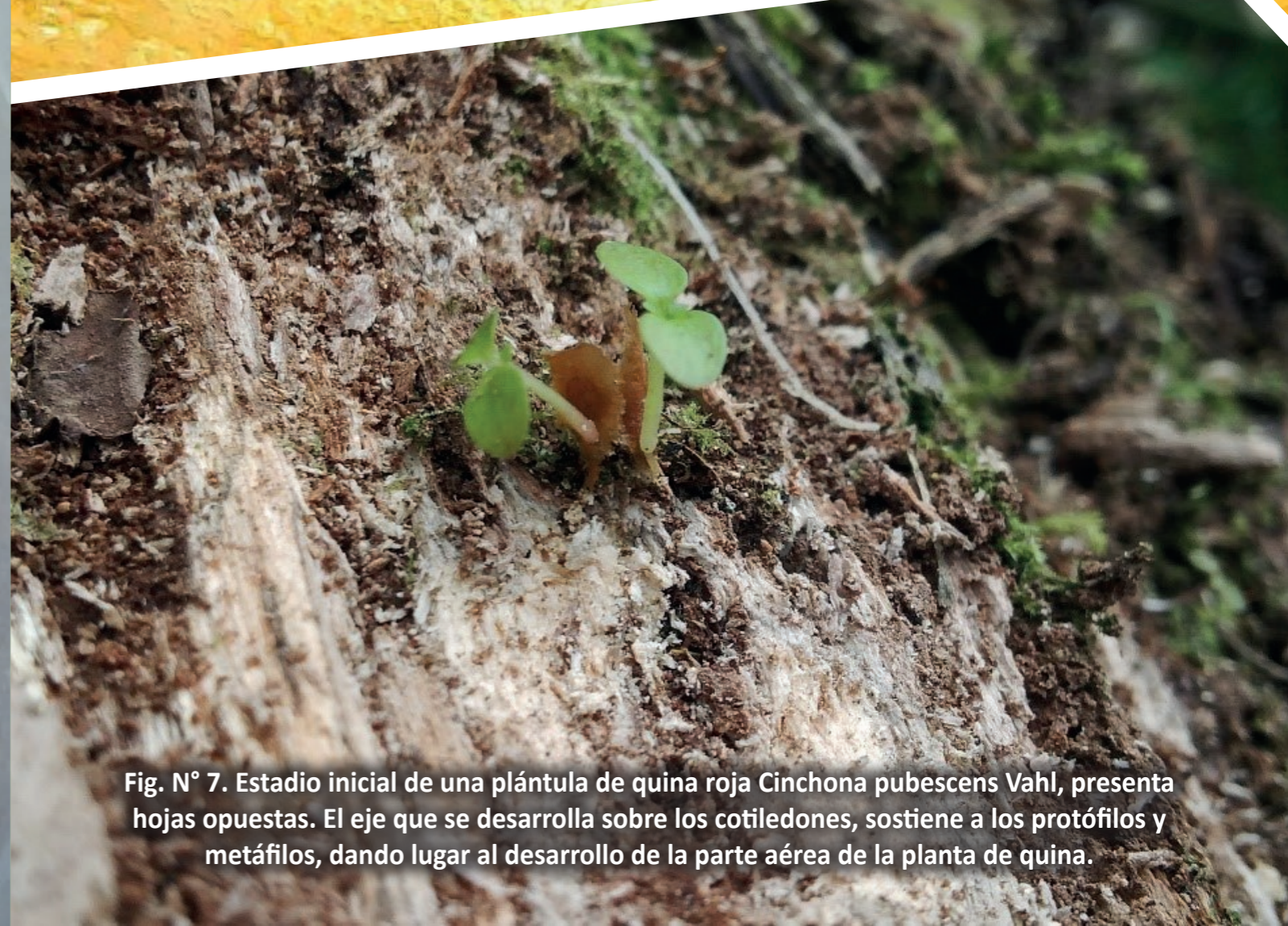
Fig. N° 7. Estadio inicial de una plántula de quina roja Cinchona pubescens Vahl, presenta hojas opuestas. El eje que se desarrolla sobre los cotiledones, sostiene a los protófilos y metáfilos, dando lugar al desarrollo de la parte aérea de la planta de quina.