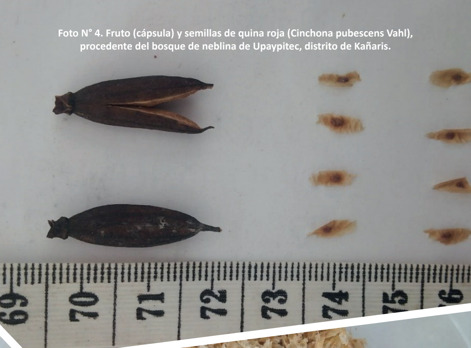
Fig. N° 5. La forma de la semilla de la quina roja, es alar (longitud menor a 3.5 veces el ancho), el margen alar de la semilla es dentado irregularmente, tamaño de la semilla entre 10 a 12 mm. Un kilo de semillas de quina contiene de 1'200,000 a 1400,000 semillas.