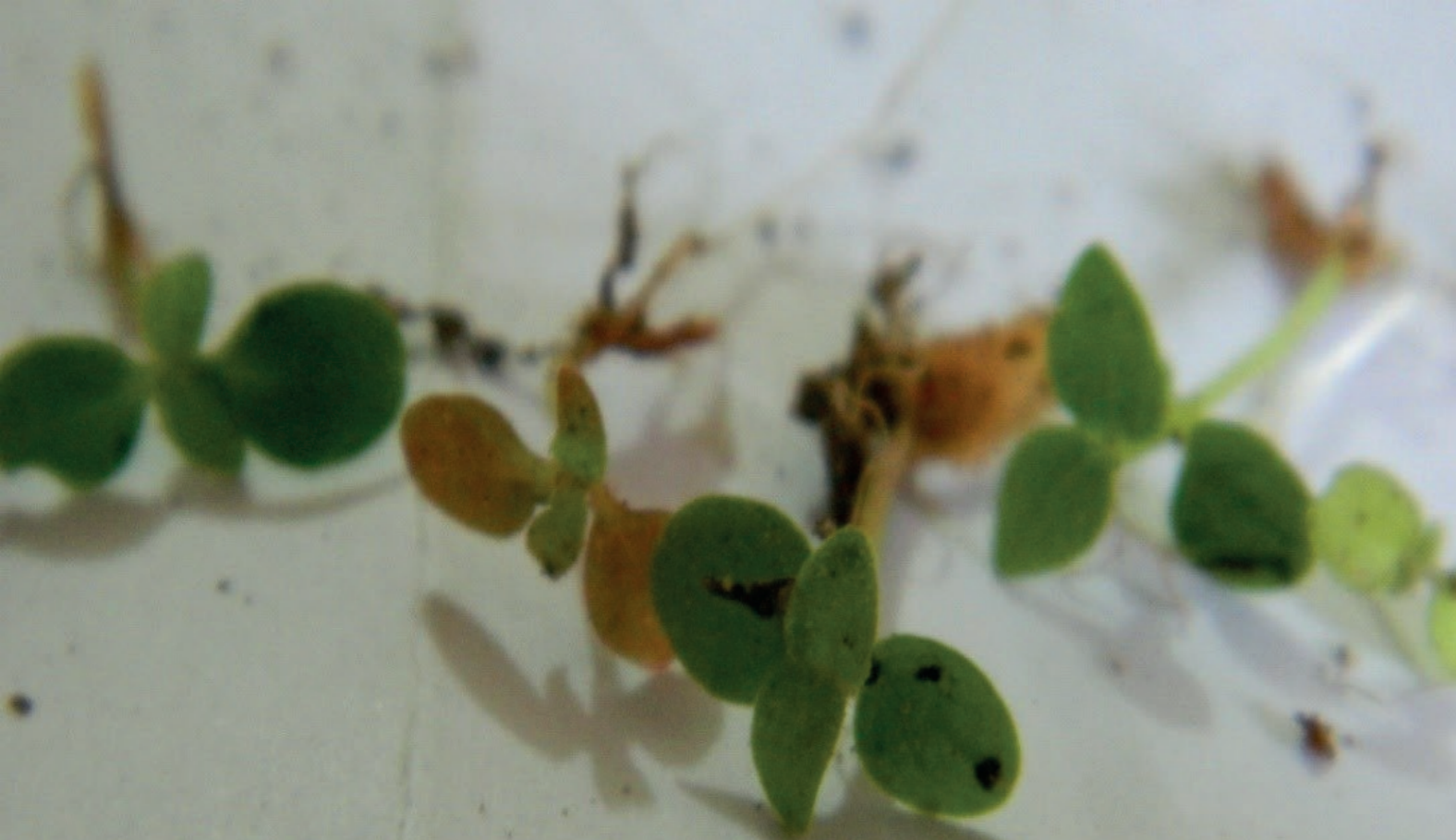
Fig. N° 8. Plántulas de quina roja o "cascarilla" con sus cotiledones y primeras hojas, lo que permite una identificación morfológica de la regeneración natural en el bosque de neblina.