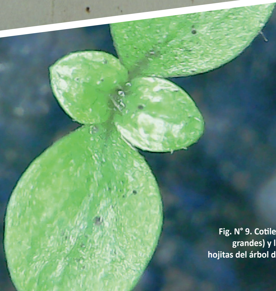
Fig. N° 9. Cotiledones (más grandes) y las primeras hojitas del árbol de quina con pilosidades