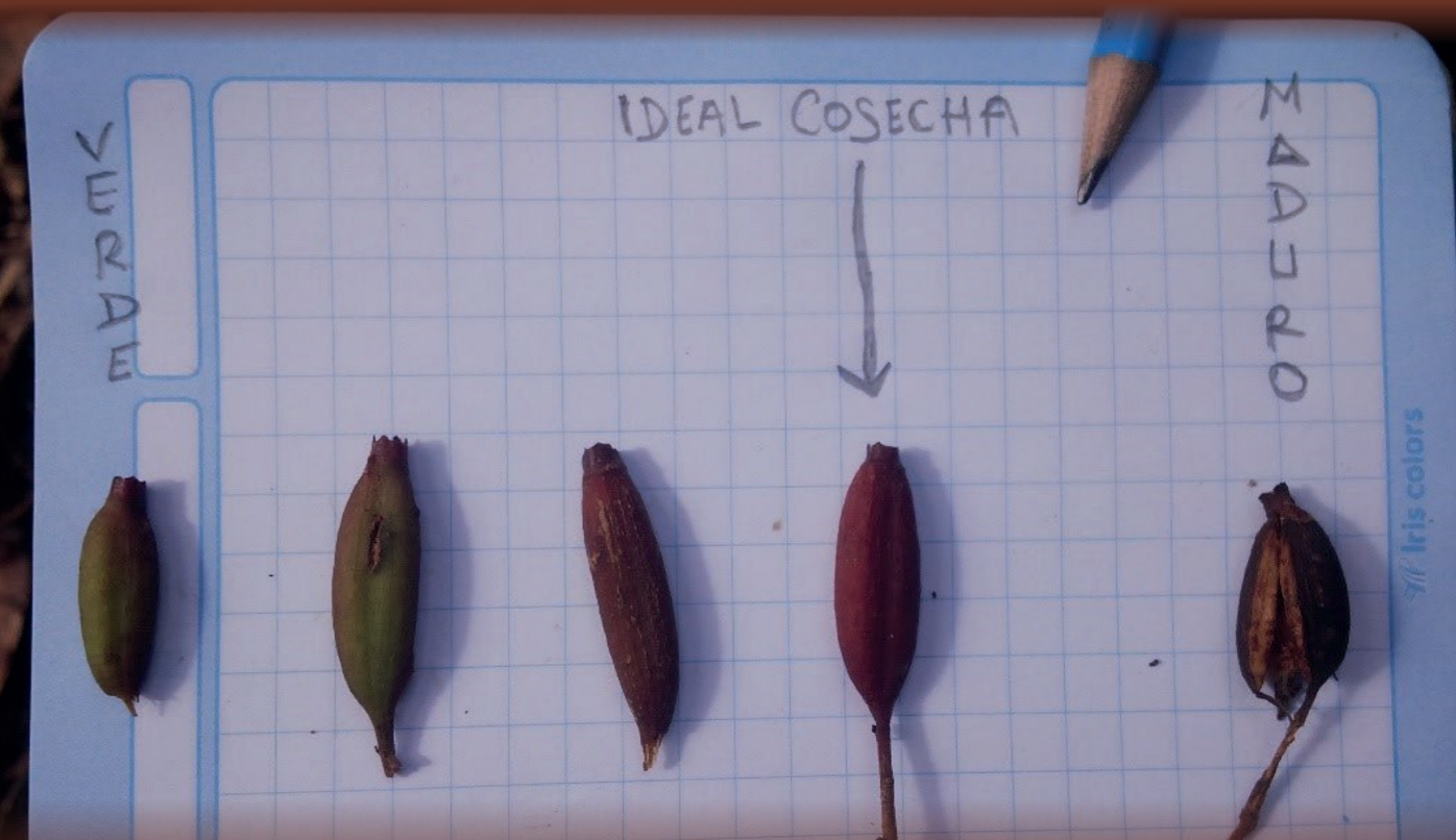
Foto N° 3. Fruto (cápsula) de quina roja ( Cinchona pubescens Vahl), mostrando las fases de madurez desde el color verde (inmaduro) hasta el color marrón oscuro (maduro), se muestra el color ideal para cosechar.