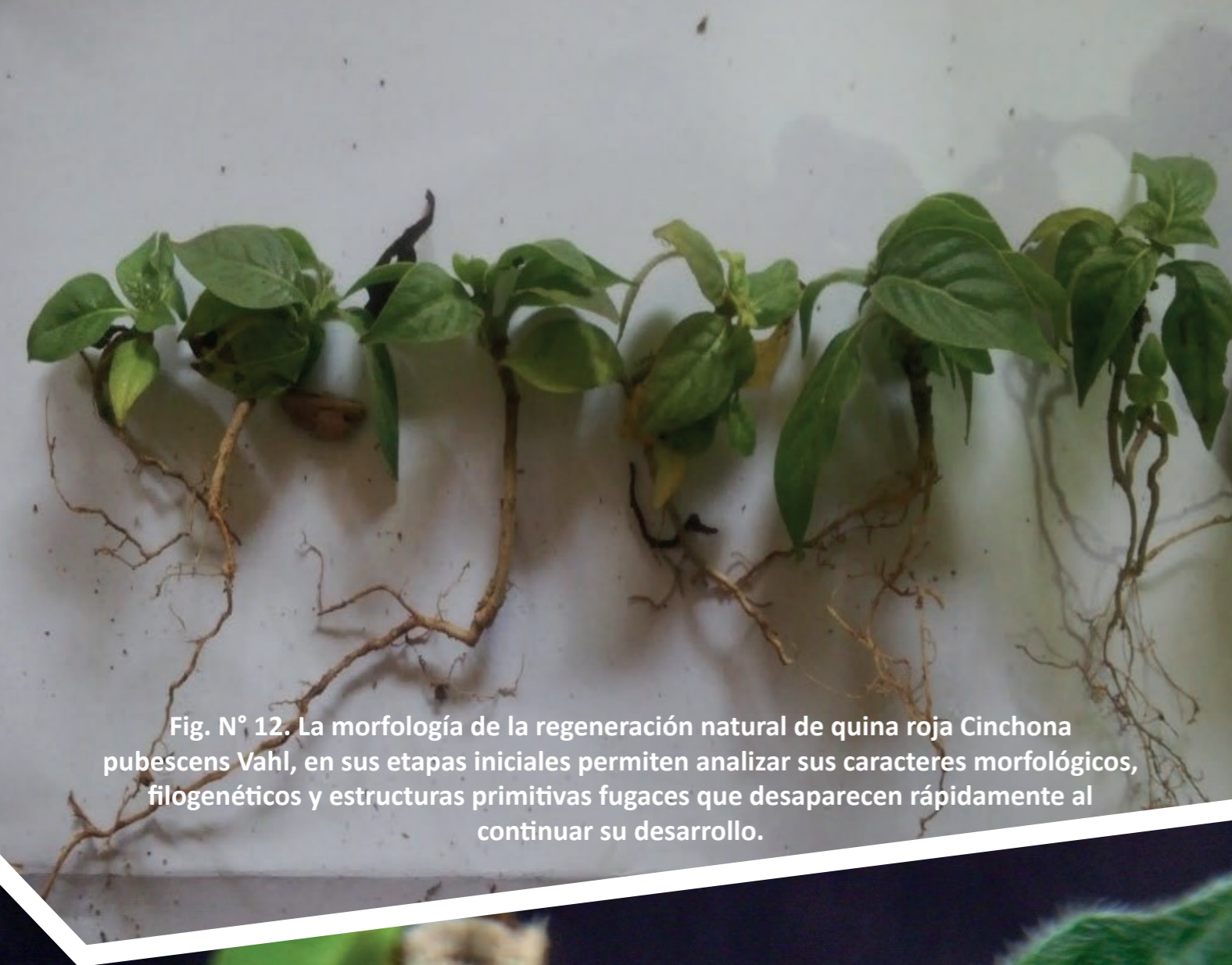
Fig. N° 12. La morfología de la regeneración natural de quina roja Cinchona pubescens Vahl, en sus etapas iniciales permiten analizar sus caracteres morfológicos, filogenéticos y estructuras primitivas fugaces que desaparecen rápidamente al continuar su desarrollo.