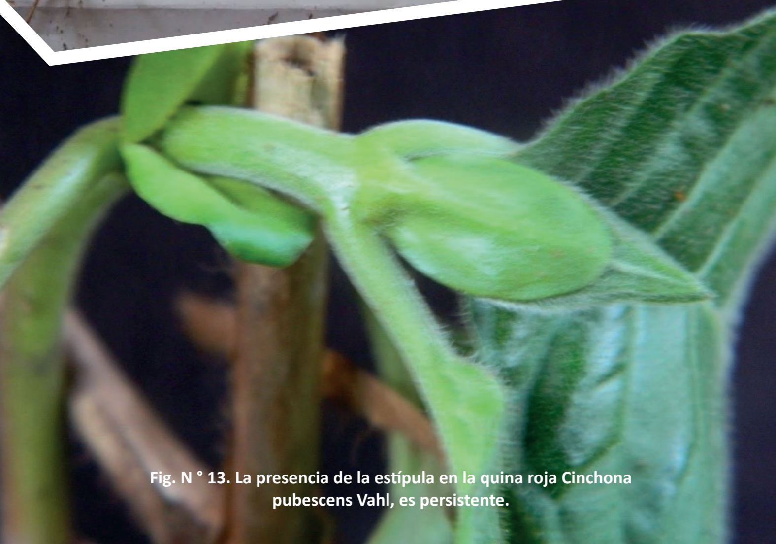
Fig. N° 13. La presencia de la estípula en la quina roja Cinchona pubescens Vahl, es persistente.