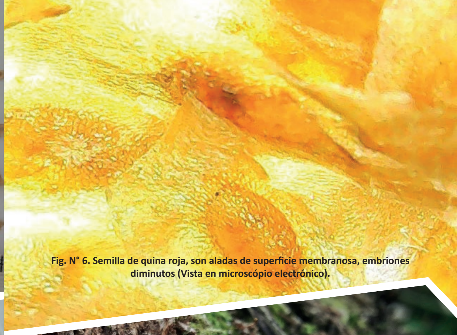
Fig. N° 6. Semilla de quina roja, son aladas de superficie membranosa, embriones diminutos (Vista en microscópio electrónico).