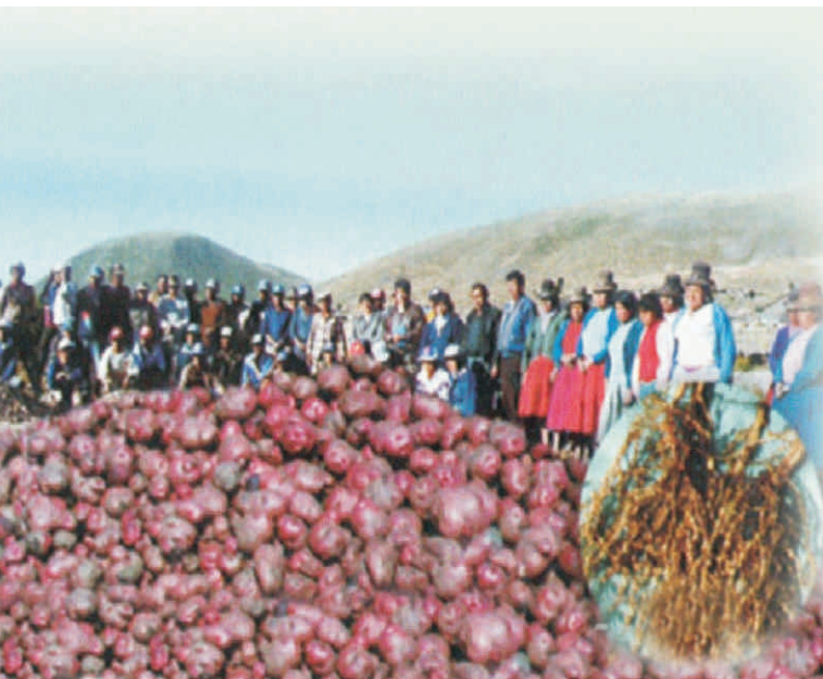
ESTACIÓN EXPERIMENTAL AGRARIA ILLPA - PUNO