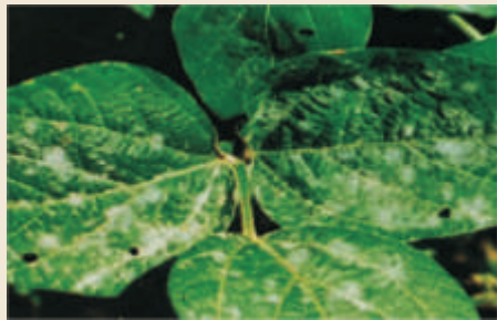
Oidium ( Erysiphe polygoni )