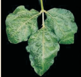
Virus del mosaico común