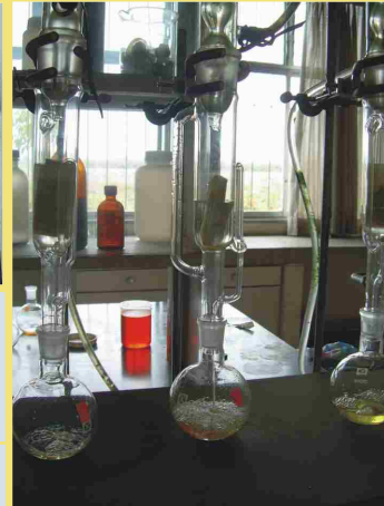
Estación Experimental Agraria Donoso - Huaral